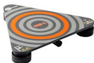
Sonda do pomiaru rezystancji podłóg i ścian PRS-1