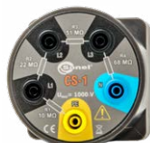
Symulator kabla CS-1