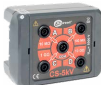
Skrzynka kalibra- cyjna CS-5kV