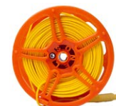
Przewód pomia- rowy na szpuli do pomiaru uziemień 50 m