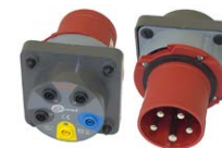
Adapter gniazd trójfazowych 63 A