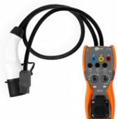
Adapter EVSE-01 do testów stacji ładowania pojazdów elektrycznych