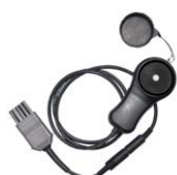
Sonda luksomierza LP-10A z wtykiem WS-06