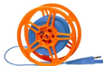
Przewód pomia- rowy na szpuli do pomiaru uziemień 25 m