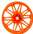
Szpuła do nawi- nięcia przewodu pomiarowego