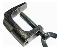
Zacisk imadłkowy (wtyk bananowy)