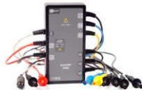
Adapter AutoISO-2500 do automatycznego pomiaru rezystancji izolacji przewodów wielżyłowych